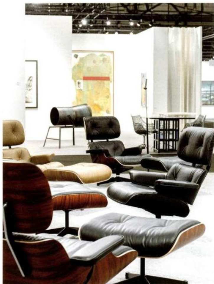
Vue de l'espace central avec les fauteuils Lounge chair de Vitra en premier plan.

La prochaine édition du salon d'art contemporain Artgenève aura lieu début février. Avec la participation du PAD, la prestigieuse foire de design historique, moderne et contemporain. L'enseigne genevoise Teo Jakob se fait elle aussi remarquer dans de nombreux espaces. JOSIANE GUILLOU-D'AVAT