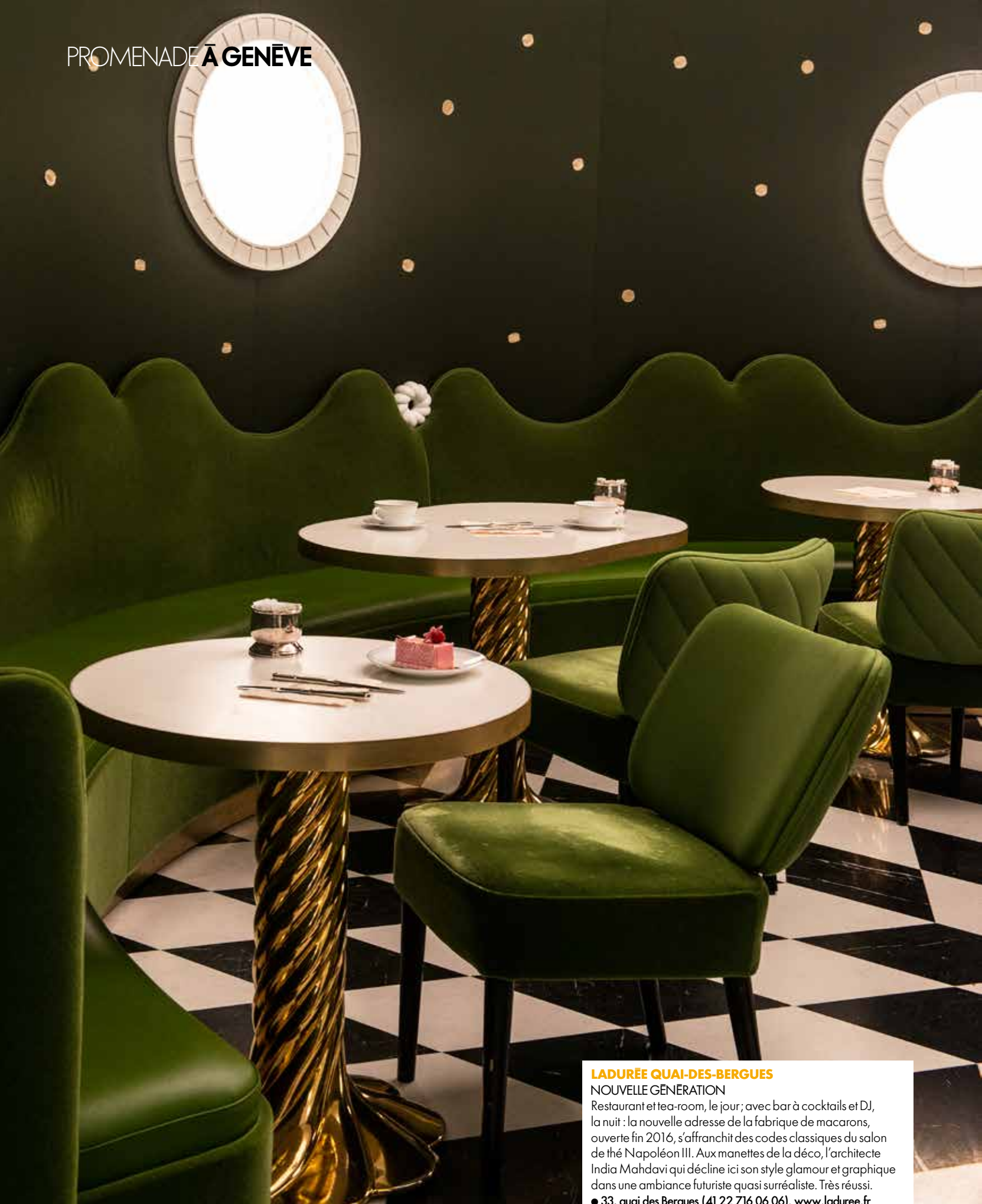
LADURÉE QUAI-DES-BERGUES NOUVELLE GÉNÉRATION Restaurant et tea-room, le jour ; avec bar à cocktails et DJ, la nuit : la nouvelle adresse de la fabrique de macarons, ouverte fin 2016, s'affranchit des codes classiques du salon de thé Napoléon III. Aux manettes de la déco, l'architecte India Mahdavi qui décline ici son style glamour et graphique dans une ambiance futuriste quasi surréaliste. Très réussi. ● 33, quai des Bergues (41 22 716 06 06). www.laduree.fr