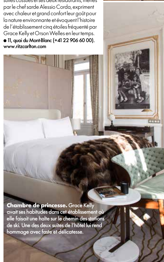
Chambre de princesse. Grace Kelly avait ses habitudes dans cet établissement où elle faisait une halte sur le chemin des stations de ski. Une des deux suites de l'hôtel lui rend hommage avec faste et délicatesse.

Figures historiques Autour du patio, les courives distribuant les chambres sont ponctuées de portraits en tapisserie. Tous sont à l'effigie de grands hommes ayant fréquenté l'hôtel, de Giuseppe Garibaldi à Victor Hugo.