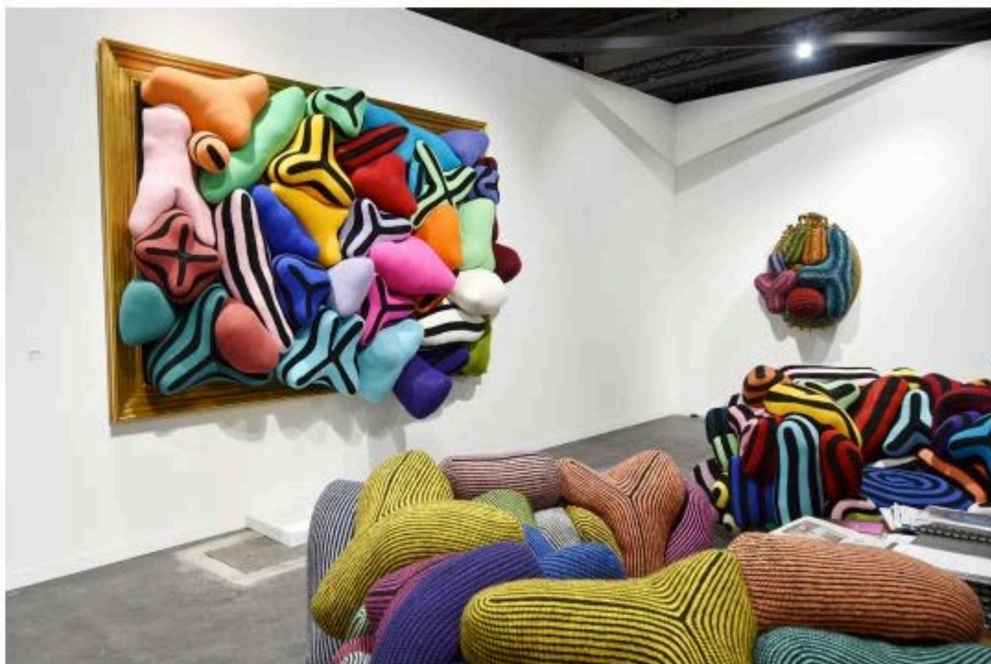
Joana Vasconcelos (*1971) chez Gowen Contemporary, Genève

Le tissu, la tapisserie et même le crochet sont autant de pistes passionnantes. À l'image des travaux colorés entre art et design de l'artiste portugaise Joana Vasconcelos (*1971) chez Gowen Contemporary, Genève.