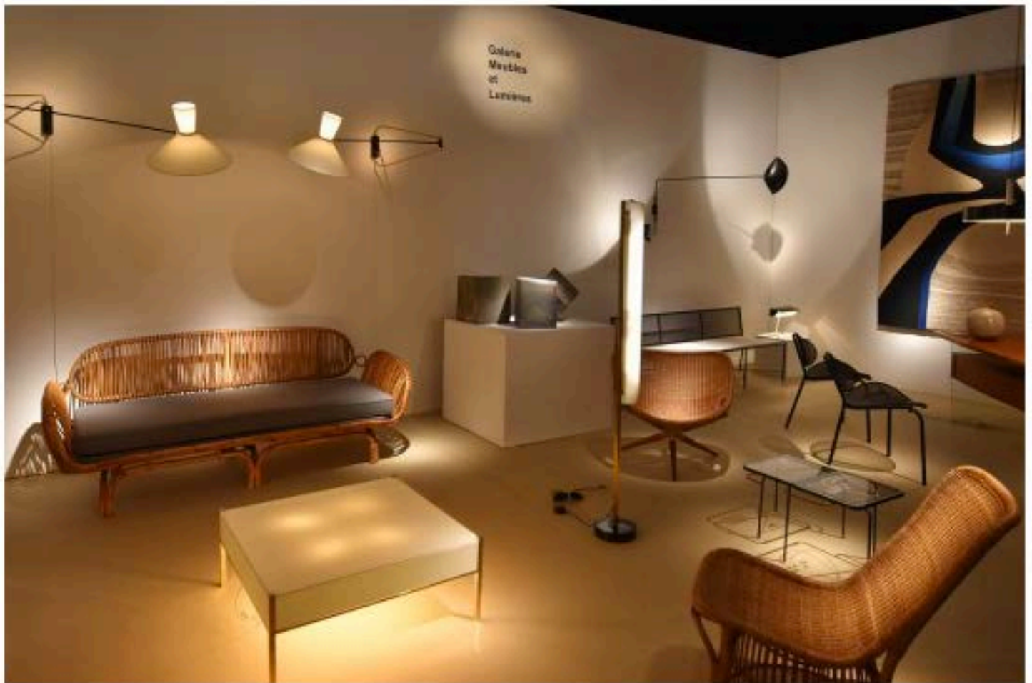
Meubles et Lumières au PAD