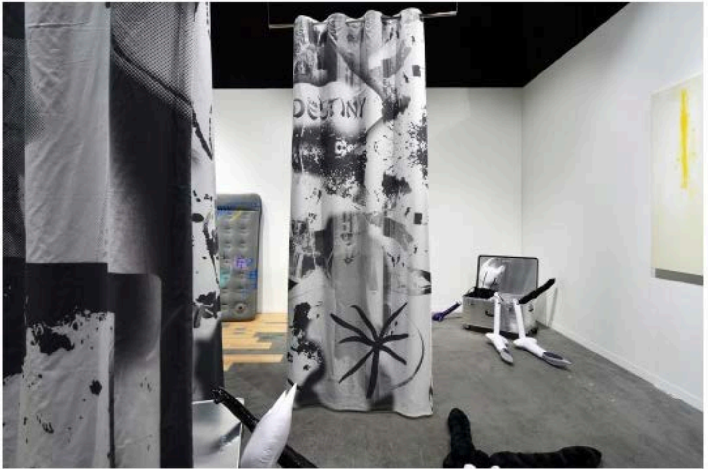
NEW HEADS ART AWARDS, HEAD Genève