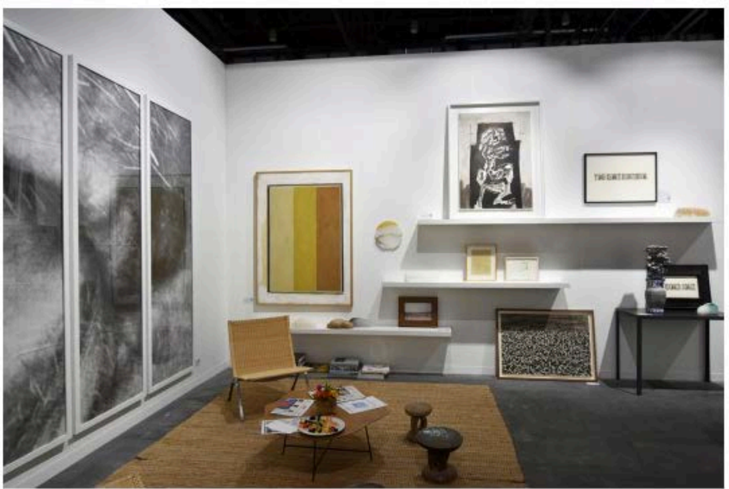
Simon Studer, Genève