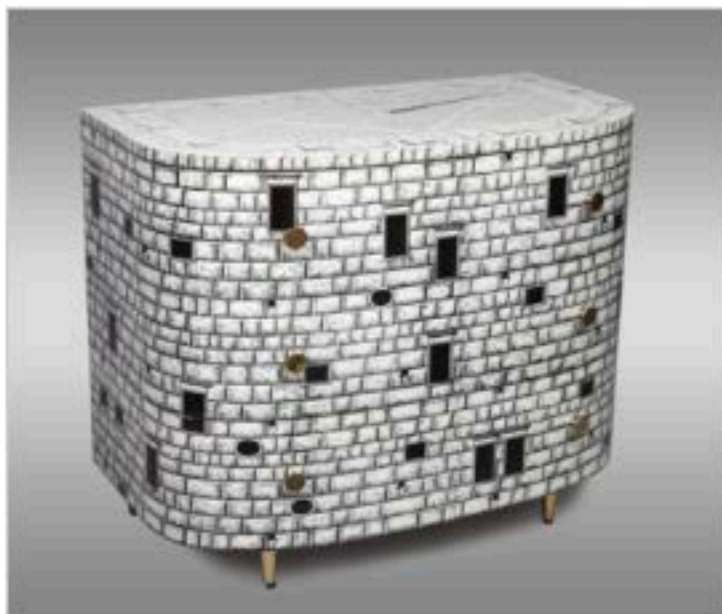
Galerie-Portuondo-Piero-Fornasetti-1913-1988- Architettura-Chest-of-Drawers-1970-legno- ricoperto-di-litografie-ottone-83x101x55-cm