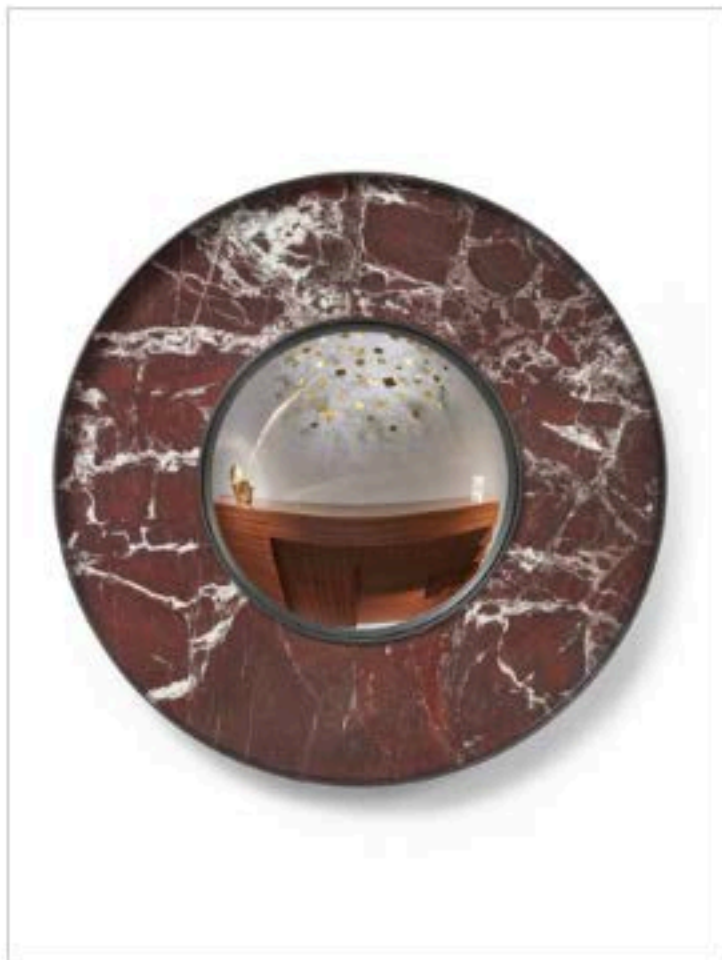
Galerie-Negropontes-Hervé-Languais-Miroir-Eclipse- 2012-marmo-rosso-Lepanto-e-ottone-patinato- diametro-103-cm.-Pezzo-unic