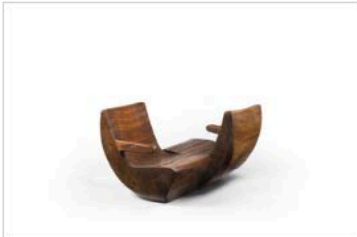
Galerie-Chastel-Maréchal-Zanine-Caldas Namoradeira-1965-Pequi-solido-scolpito-in-un- unico-pezzo-59x88x78-cm