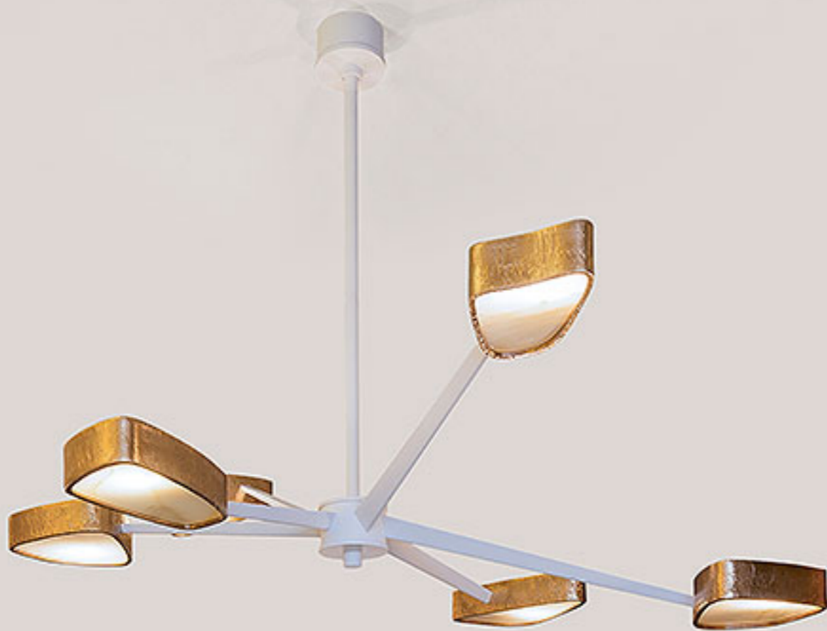
Светильник Spider white, Achille Salvagni Atelier. 2017. Патинированная литая бронза, черный оникс. Maison Gerard Gallery.

С 2018 года в календаре появился третий PAD, который в начале февраля готовится впервые принять Женева. После того, как Великобритания объявила о своем выходе из Евросоюза, Швейцария негласно считается самой перспективной страной для продажи и презентации дорогого современного искусства и дизайна, предназначенного для музеев и амбициозных частных собраний. Здесь по-прежнему деньги чувствуют себя в относительной безопасности, здесь любят и ценят XX век, очень развит вкус ко всему современному, кроме того, альпийские курорты привлекают людей с солидными финансами. Уже в седьмой раз здесь проходит ярмарка Art Geneve, которая растет и хорошеет на глазах.