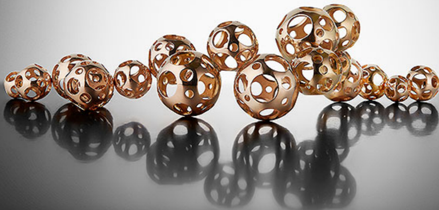
Браслет из розового золота, диз, В. Аккад, Walid Akkad, Париж.

С 2018 года в календаре появился третий PAD, который в начале февраля готовится впервые принять Женева. После того, как Великобритания объявила о своем выходе из Евросоюза, Швейцария негласно считается самой перспективной страной для продажи и презентации дорогого современного искусства и дизайна, предназначенного для музеев и амбициозных частных собраний. Здесь по-прежнему деньги чувствуют себя в относительной безопасности, здесь любят и ценят XX век, очень развит вкус ко всему современному, кроме того, альпийские курорты привлекают людей с солидными финансами. Уже в седьмой раз здесь проходит ярмарка Art Geneve, которая растет и хорошеет на глазах.