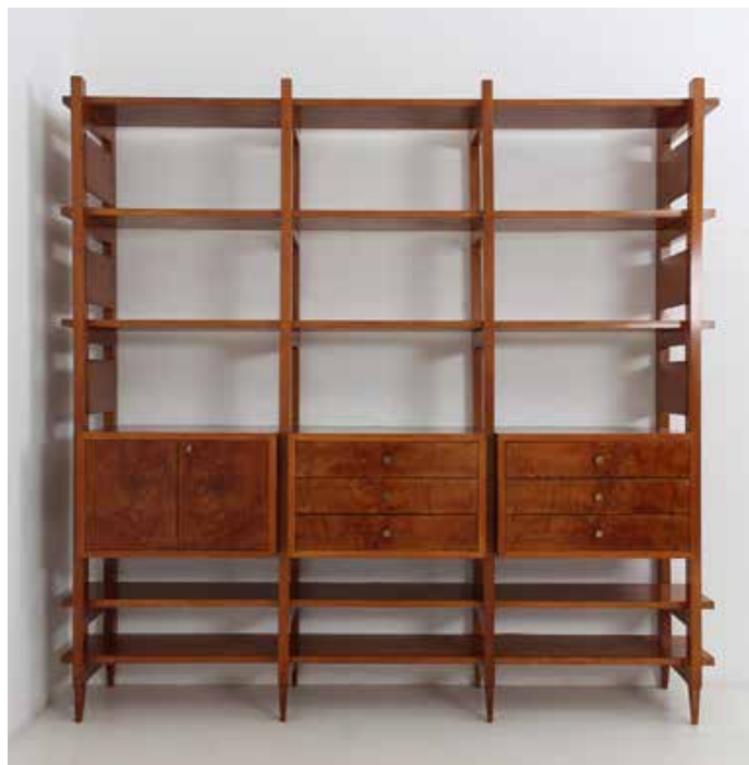
SOPRA, DA SINISTRA: "Natura morta con caraffa e lanterna", gouache e acquerello su carta di Le Corbusier, 1922, cm 55x46, da Aktis gallery; libreria di Gio Ponti del 1950 da Dimore gallery (entrambi al Pad London).

rin, la fiera di arte e design quest'anno si arricchisce di undici nuovi espositori, tra i quali Thomas Fritsch-Artrium (Parigi), nel settore del