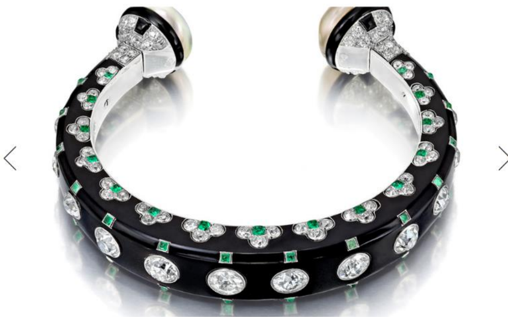
18-18 ART DECO DIAMOND, NATURAL PEARL, EMERALD, AND ONYX BANGLE BY CARTIER PARIS, CIRCA 1925, SIEGELSON NEW YORK.