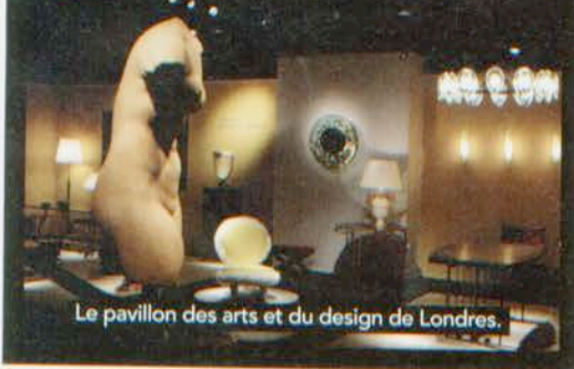
Le pavillon des arts et du design de Londres.