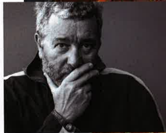
Philippe Starck Un de ses derniers opus, l'hôtel Brach, un ancien tri postal métamorphosé en palace à la fois fantaisiste et convivial au cœur du 16 e arrondissement parisien.