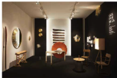
Vue du stand de la galerie Mica, prix spécial du jury 2019.