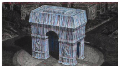
Christo, L'Arc de Triomphe emballé (Projet pour Paris - Place de l'Étoile-Charles de Gaulle), 2019. © 2019 Christo