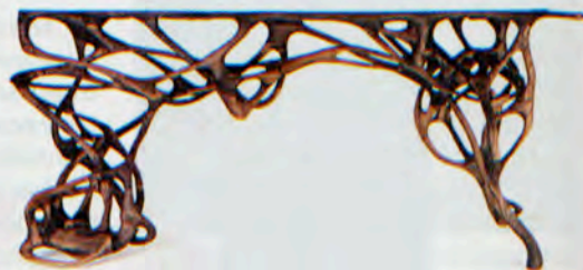
"Growth Table" de Mathias Bengtsson.

Jardin des Tuileries, esplanade des Feuillants, Paris 1 er , du 26 au 29 mars. www.pad-fairs.com