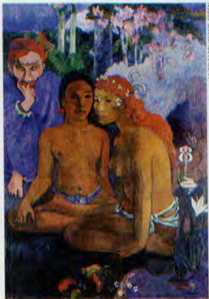
Retour aux sources, nature luxuriante et figures empreintes de mystère pour ces "Contes barbares" de 1902.

L'événement a demandé six années de préparation et réunit une cinquantaine de peintures et de sculptures venues de treize pays différents et mettant à contribution les plus