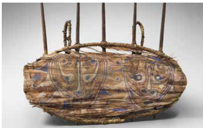
© Alain Bovis | Vincent Luc

Quartier Saint-Germain-des-Prés, entre les rues Bonaparte et Guénégaud www.paristribal.com